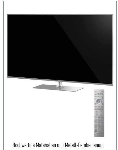
Hochwertige Materialien und Metall-Fernbedienung

Neue Möglichkeiten des Fernsehens – Unterstützung von TV>IP , zahlreicher Apps und des HbbTV Operator App Standards