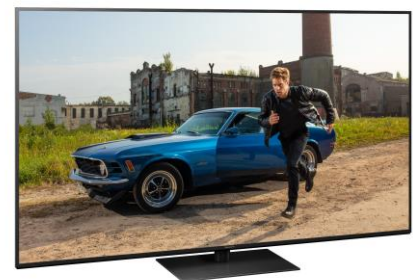
75" Variante mit elegantem Metallstandfuß*